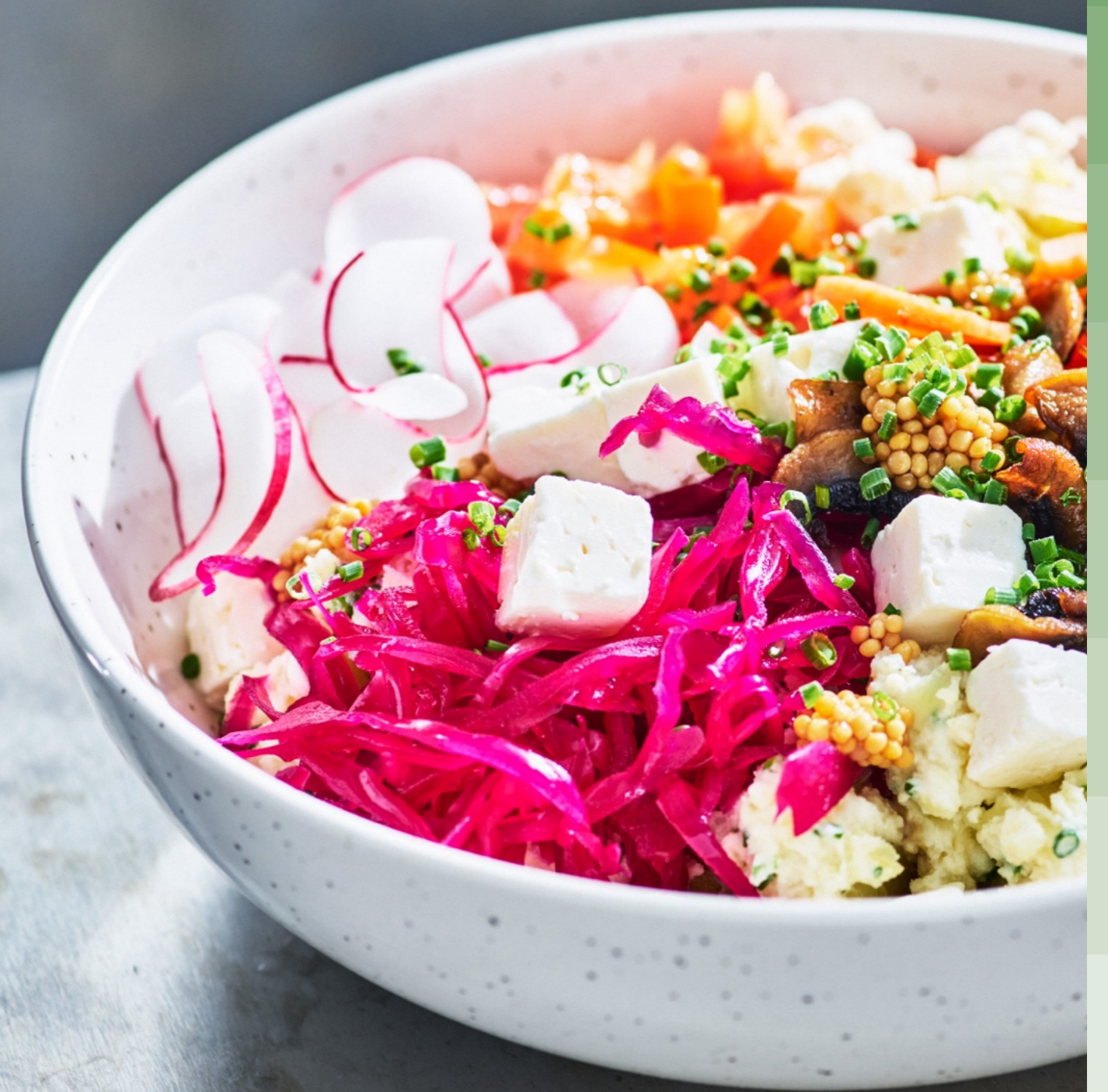
Bowl med krossad potatis och vitost

265 g Arla Apetina® tärnad vitost i olja, örter & kryddor 21 % Artikelnummer: 61681 Antal: 6 Netto, vikt/krt, låda: 1590 g Förptyp best.enhet: krt Antal kart pall/lav: 198/22