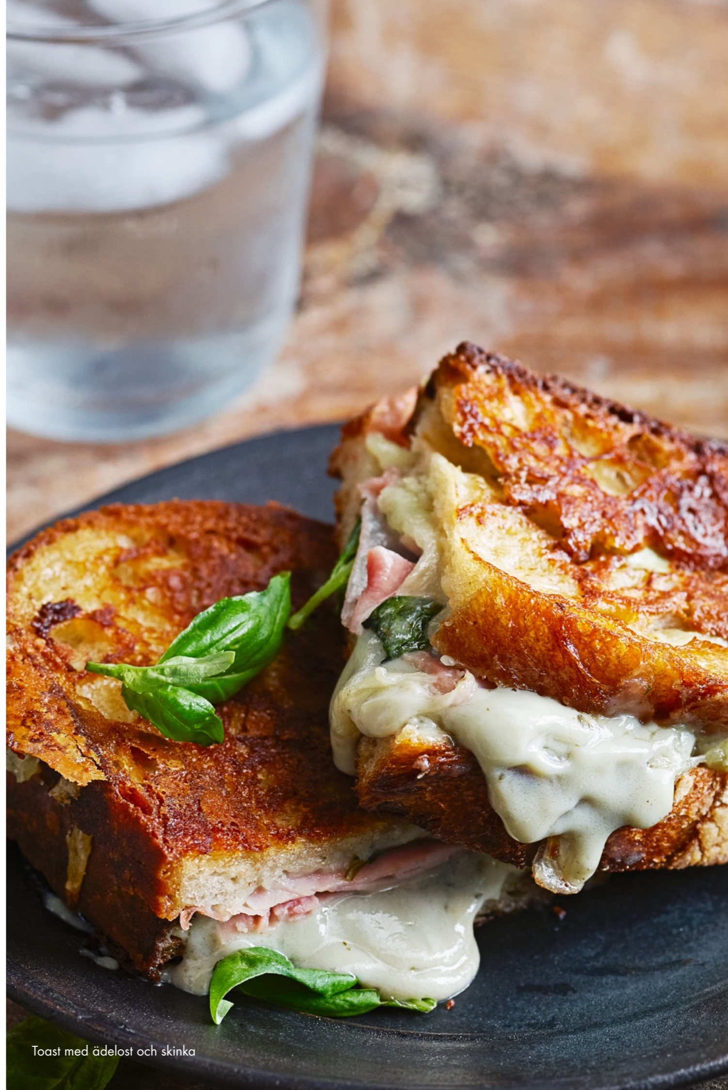
Toast med ädelost och skinka

140 g Kvibille® ädel whisky 36 % Artikelnummer: 701407 Antal: 10 Netto vikt/krt, låda: ca 1400 g Förp typ best.enhet: krt Antal kart pall/lav: 300/10